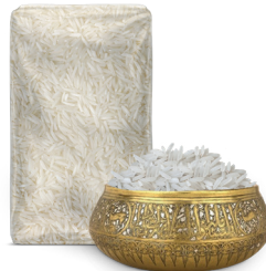
LONG GRAIN RICE طويل الحبة