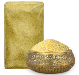
FINE BULGUR ناعم برغل