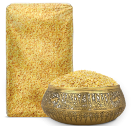
MEDIUM BULGUR وسط برغل