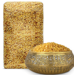
COARSED BULGUR خشن برغل