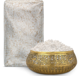
CALROSE RICE الأرز كالروز