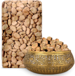
BROAD BEANS فول