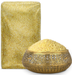
SEFERKITE BULGUR سفركيتل برغل