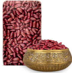
RED KIDNEY BEANS الفاصولياء الحمراء