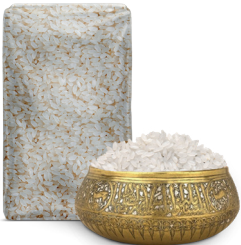
BALDO RICE أرز بالدو