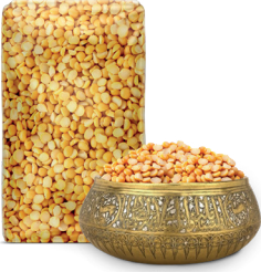
YELLOW SPLIT PEAS بازلاء صفراء مجروش