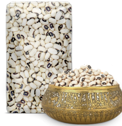
BLACK EYED BEANS لوبيا بيضاء