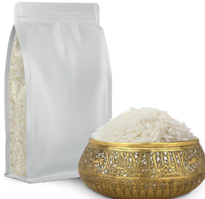
1121 SELLA BASMATI 1121 أرز بسمتي سيللا