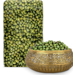
MUNG BEANS فاصولياء الماش الأخضر